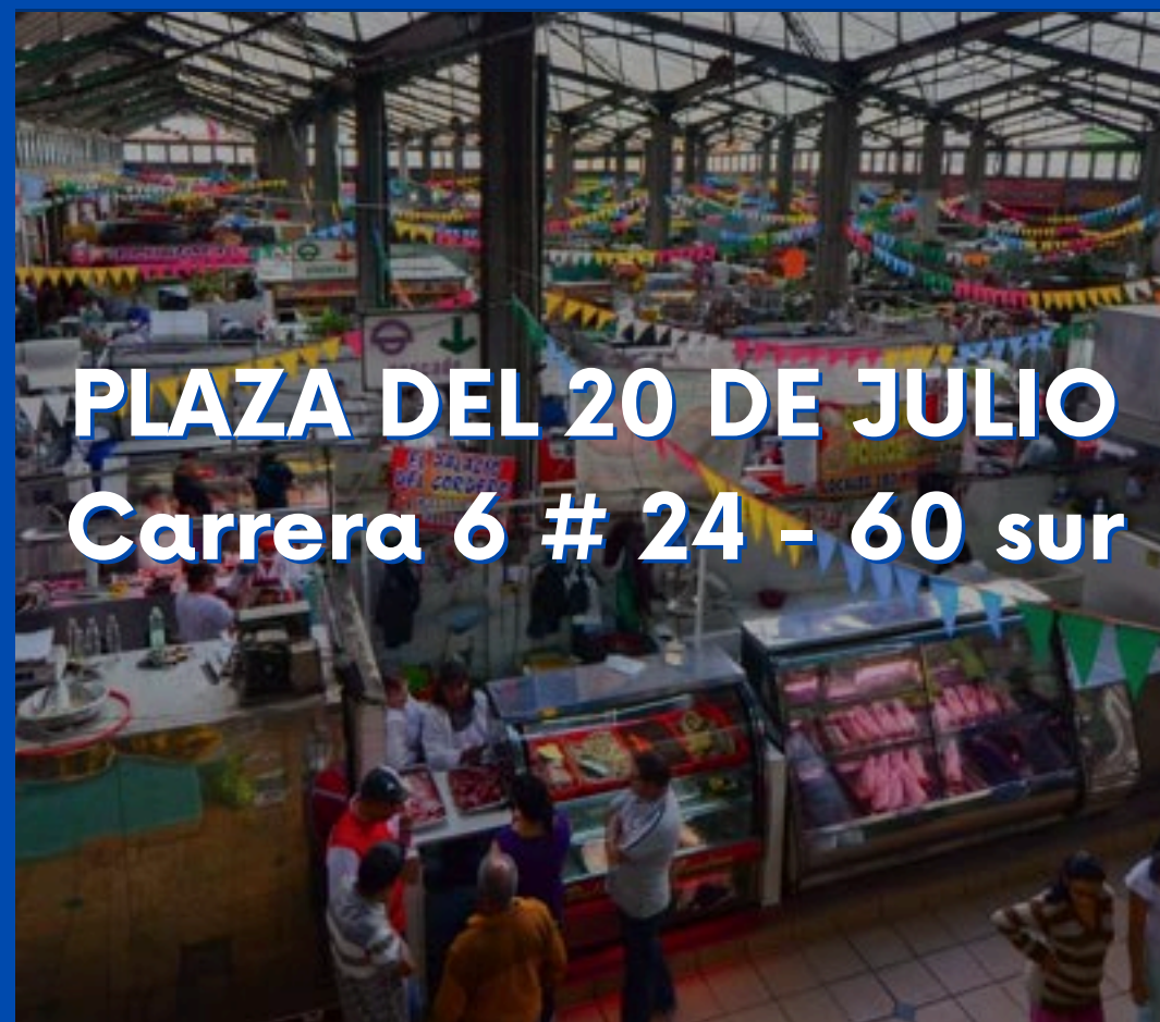
PLAZA DEL 20 DE JULIO Carrera 6 # 24 - 60 sur