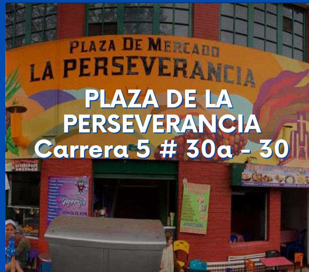
PLAZA DE LA PERSEVERANCIA Carrera 5 # 30a - 30