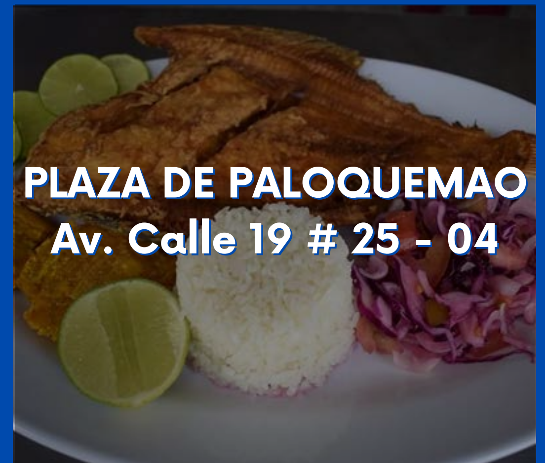
PLAZA DE PALOQUEMAO Av. Calle 19 # 25 - 04